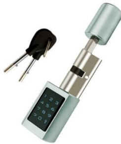
Smart e-Zylinder Z