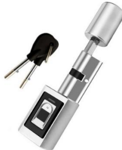
Smart e-Zylinder F