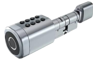
Smart e-Zylinder ZF